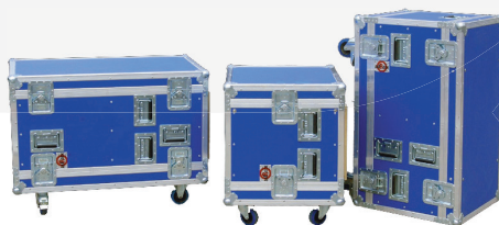
Weitere Flightcase Verteiler